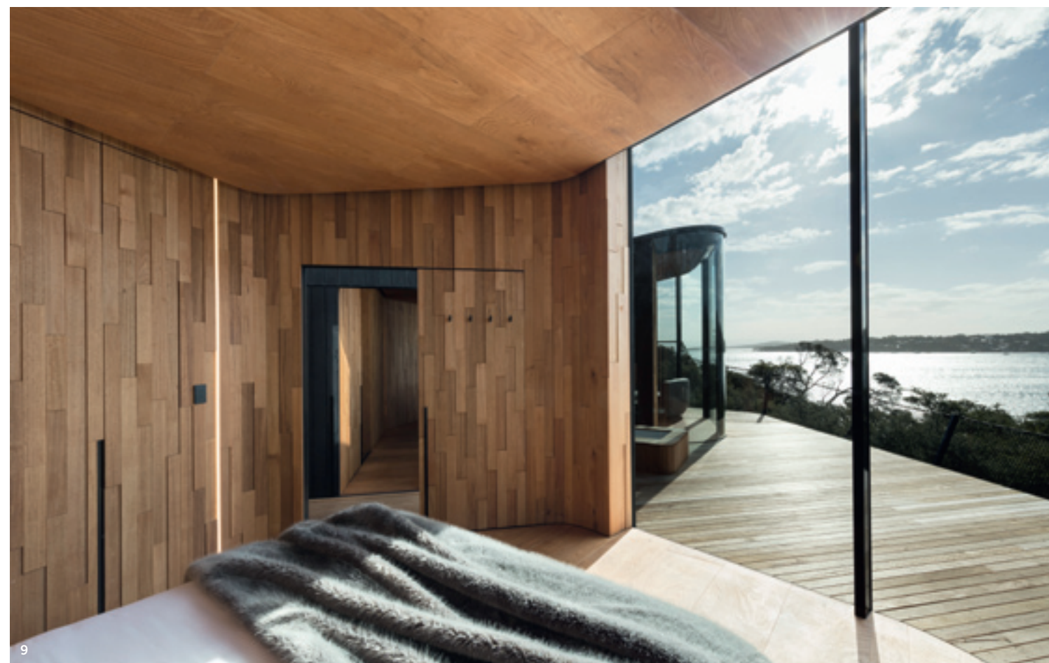
8/La textura y el relieve de la madera de Tasmania conectan con el entorno, creando un interesante juego de luces y sombras. 9/Planos acristalados de suelo a techo abren las vistas a la bahía.

evita competir con el hermoso paisaje”, señala Peta Heffernan, codirectora de Liminal Studio.